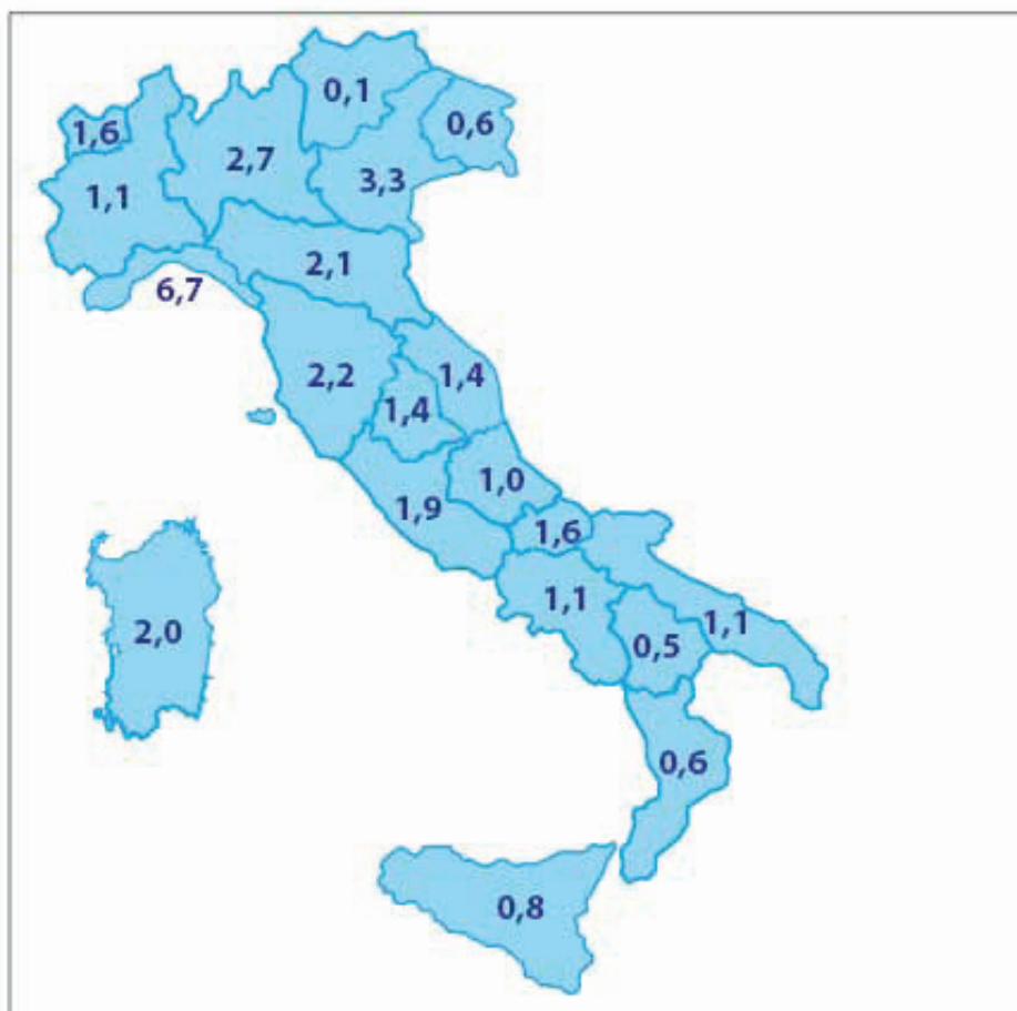
Figura 3: incidenza di AIDS per 100.000 residenti per regione di residenza

I casi di AIDS prevalenti sono in costante aumento nell'ultimo decennio per attestarsi in Lombardia a 6.328 soggetti nel 2012 (pari a 27.5% della quota nazionale). I numeri sopra riportati comportano inevitabilmente un notevole impatto sul budget del Servizio Sanitario Regionale, dove il solo costo della terapia antiretrovirale è aumentato in modo progressivo dai circa 92 milioni di euro del 2004 agli oltre 200 milioni di euro del 2012.